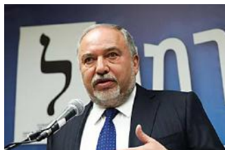
שידור חי: ליברמן מגיב להאשמות הליכוד נגדו