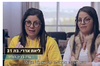
"בגובה העיניים": מה כל כך מעצבן באנשים שעדיין גרים